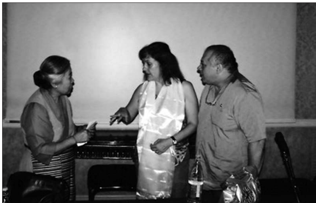
INCONTRO CON JETSUN PEMA , SORELLA DEL DALAI LAMA...