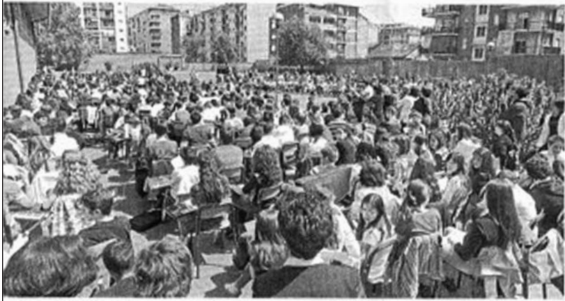
Il Giardino dei Giusti della scuola Vivaldi di via Castelfelfino 26, inaugurato ieri mattina: nepta 30 giacchette

INAUGURATO IERI ALLA «VIVALDI» DI VIA CASTELDEFINO