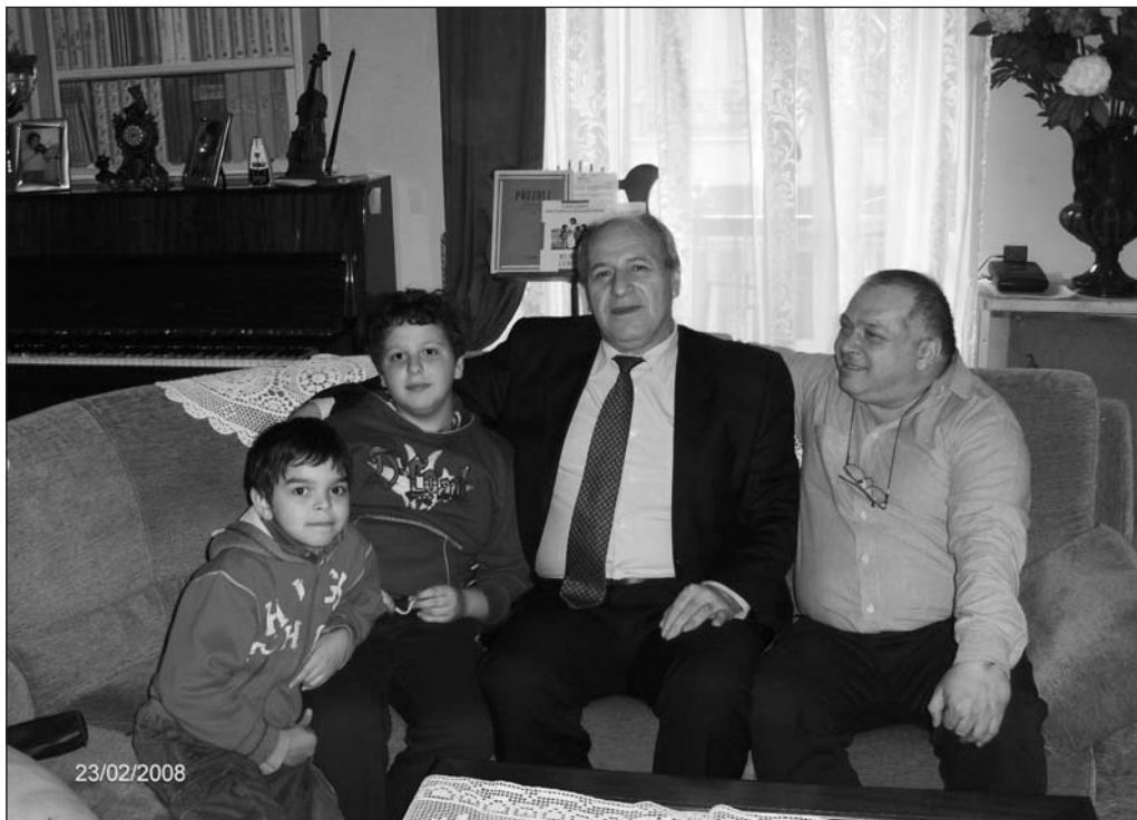
INCONTRO CON UMAR KHANBIEV, GIÀ MINISTRO DELLA SALUTE DEL GOVERNO CECENO

AL TEATRO DI TORINO giovani della scuola Filippo Juvarra eseguono brani di classica insieme con i musicisti dell'«Ensemble Baroque», per combattere i tanti problemi sociali