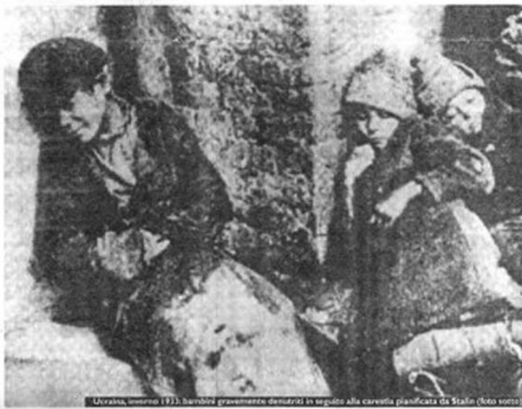
Ucraina, inverno 1933. Bambini gravemente denutriti in seguito alla carestia pianificata da Stalin

M orti due volte. Prima per la fame. Poi per l'oblio in cui furono seppelliti per oltre settant'anni dal regime sovietico. Gli ucraini sterminati da Stalin tra il 1932 e il 1933 sono stati loro malgrado i protagonisti di una delle pagine più nere del comunismo. Per la prima volta nel corso della storia uno Stato usò a fini politici la confisca di beni alimentari come arma di distruzione di massa del proprio popolo. Holodomor ("fame di massa") è il neologismo entrato nella lingua ucraina per identificare una tragedia senza precedenti. Uno sterminio tra i più ignorati: Stalin intrinse l'assoluto silenzio. E la censura fu applicata alla perfezione. Alla persecuzione ucraina è dedicata la nuova campagna di sensibilizzazione del "Comitato storico-umanitario un Giardini dei Giusti a Torino", presieduto da Pasquale Totaro. Un organismo nato per promuovere nel capoluogo piemontese un parco che ricordi i crimini contro l'umanità nel Novecento: 36 aiuole, ognuna dedicata ad una persecuzione di massa, con particolare riguardo per i Giusti (36 secondo un'antica tradizione ebraica), coloro che hanno saputo rispondere all'odio con l'amore. Oltre a suscitare l'attenzione di associazioni e istituzioni in